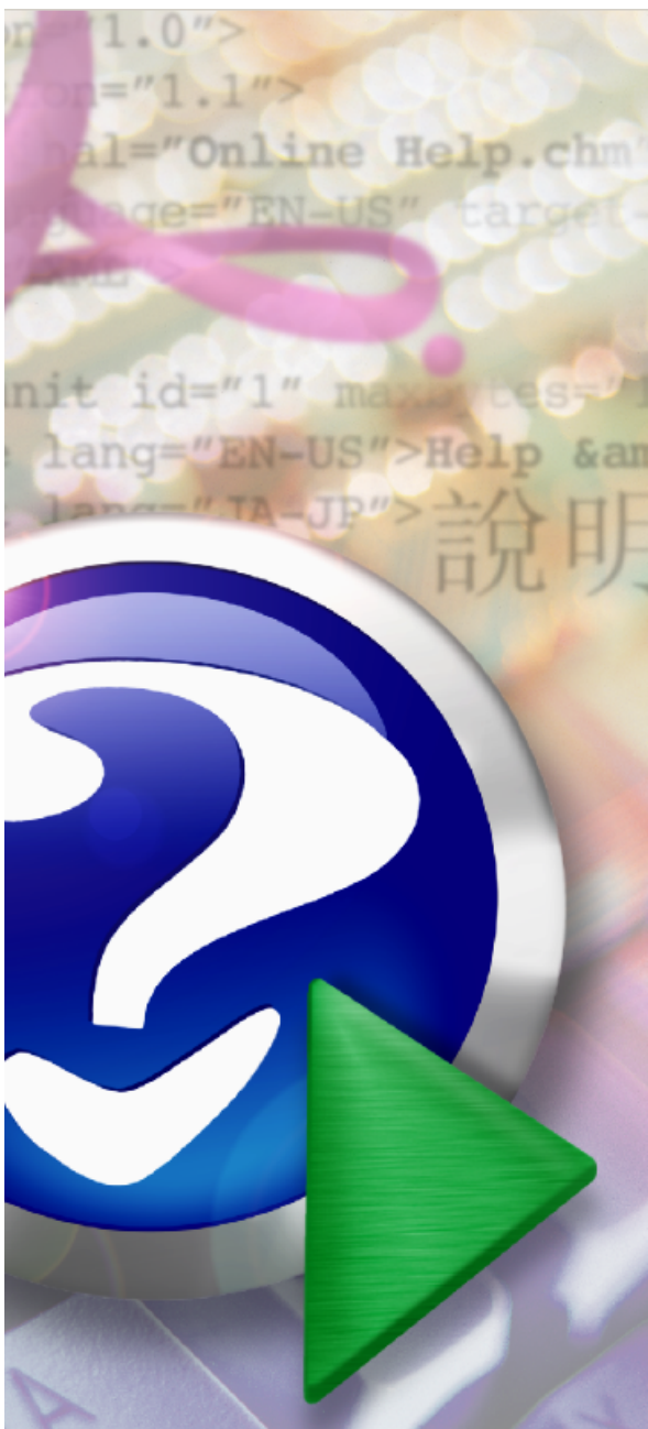
Bocon Sistema de Demonstração